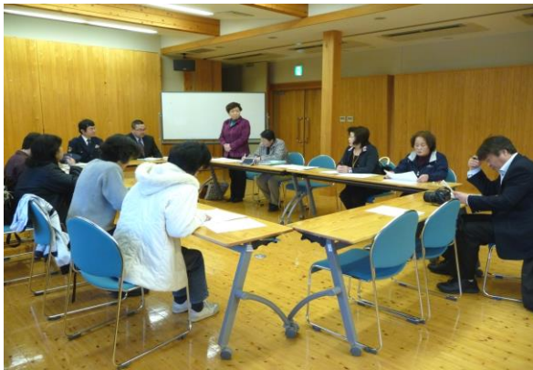
徘徊模擬訓練打ち合わせ会

活動の主なものを紹介すれば、サポーターと協力して定期的に介護家族会を開催、警察、消防等と連携しての「徘徊模擬訓練」の実施、サロンの