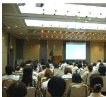
「医療講話：寺子屋」の様子