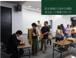
演者の著書にサインを 求める参加者